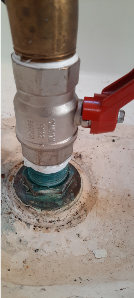
SOSTITUZIONE VALVOLE CON INOX