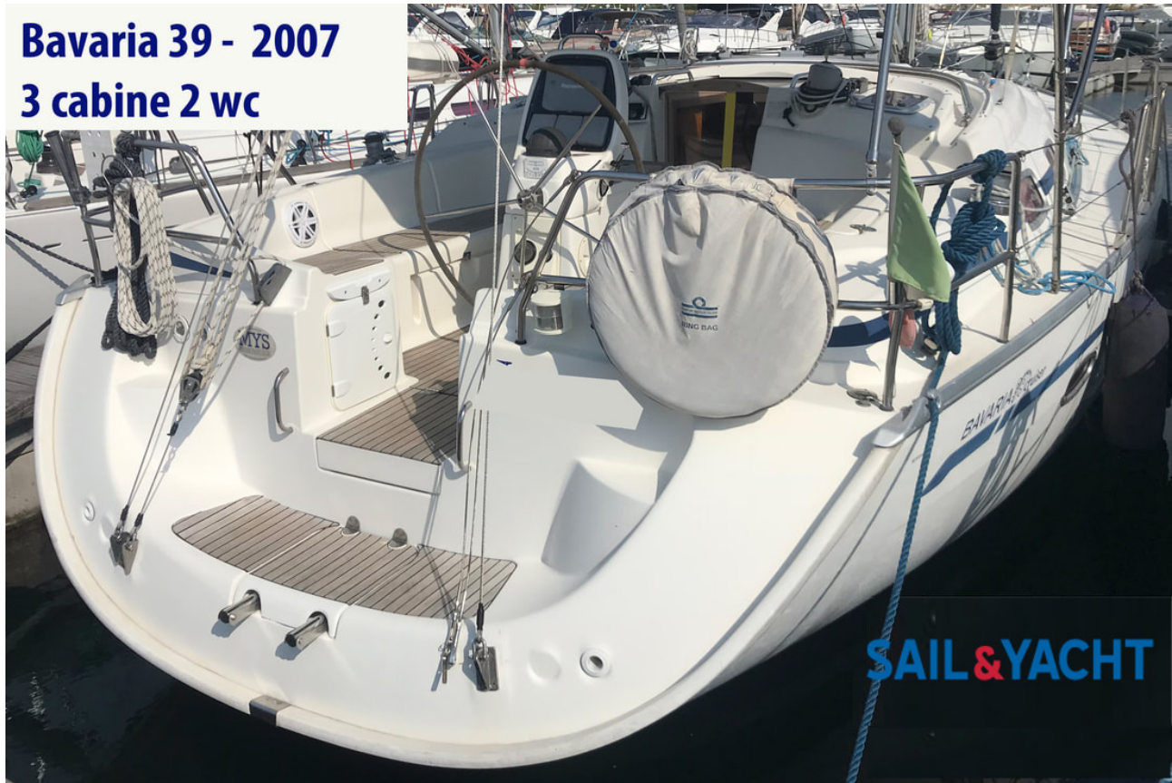
Bavaria 39 - 2007 3 cabine 2 wc

Cantiere/Modello Bavaria 39 Cruiser Categoria Usato Lunghezza 11,83 metri Larghezza 3,87 metri Anno di Immatricolazione 2007 Anno di Costruzione 2007 Bandiera Italiana Visibilità Napoli