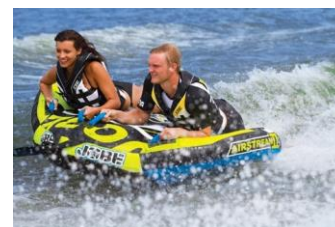
JOBE AIRSTREAM 2 POSTI