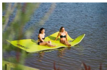
JOBE WATER CARPET