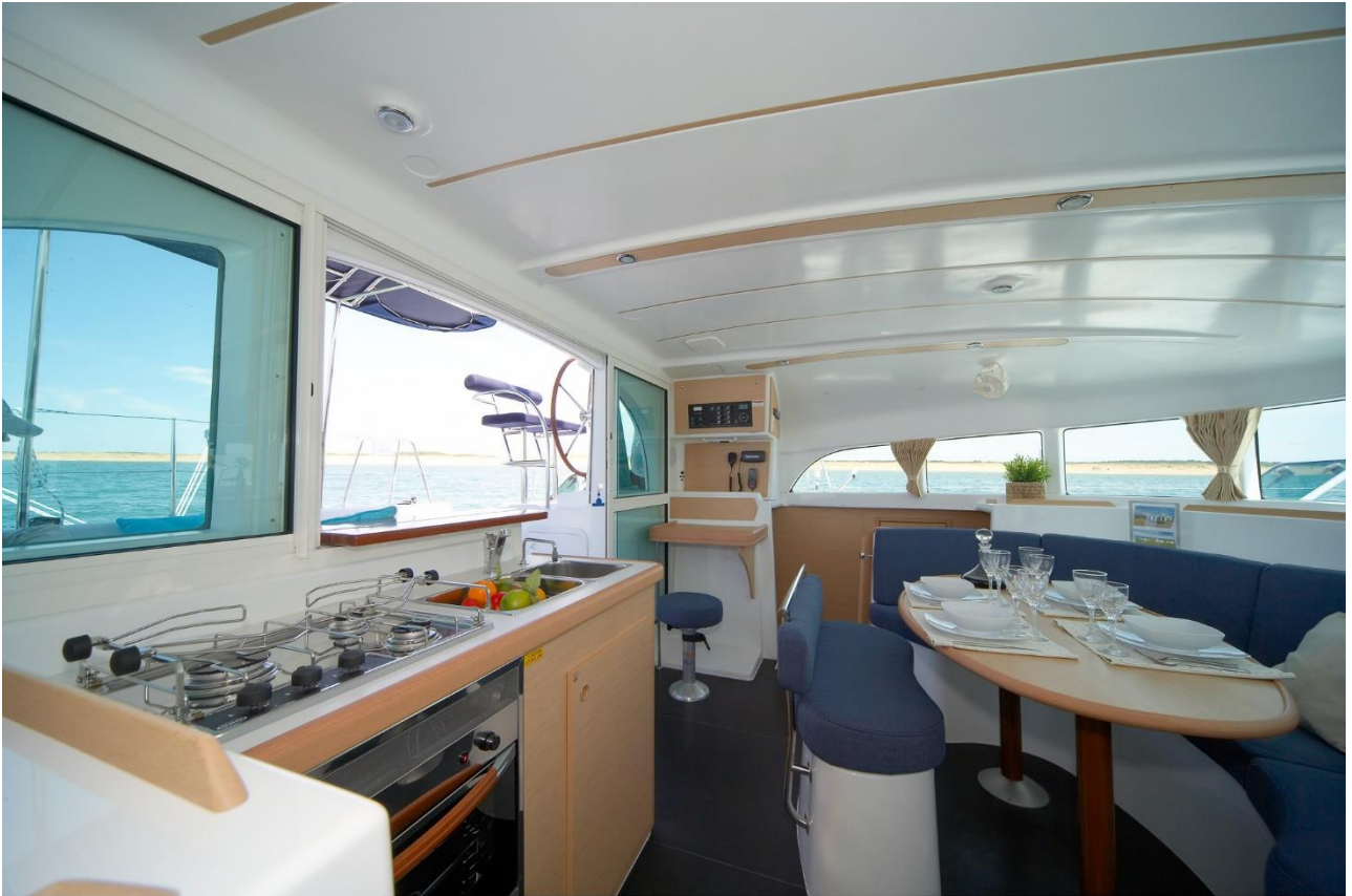
Lagoon 380 club/premium