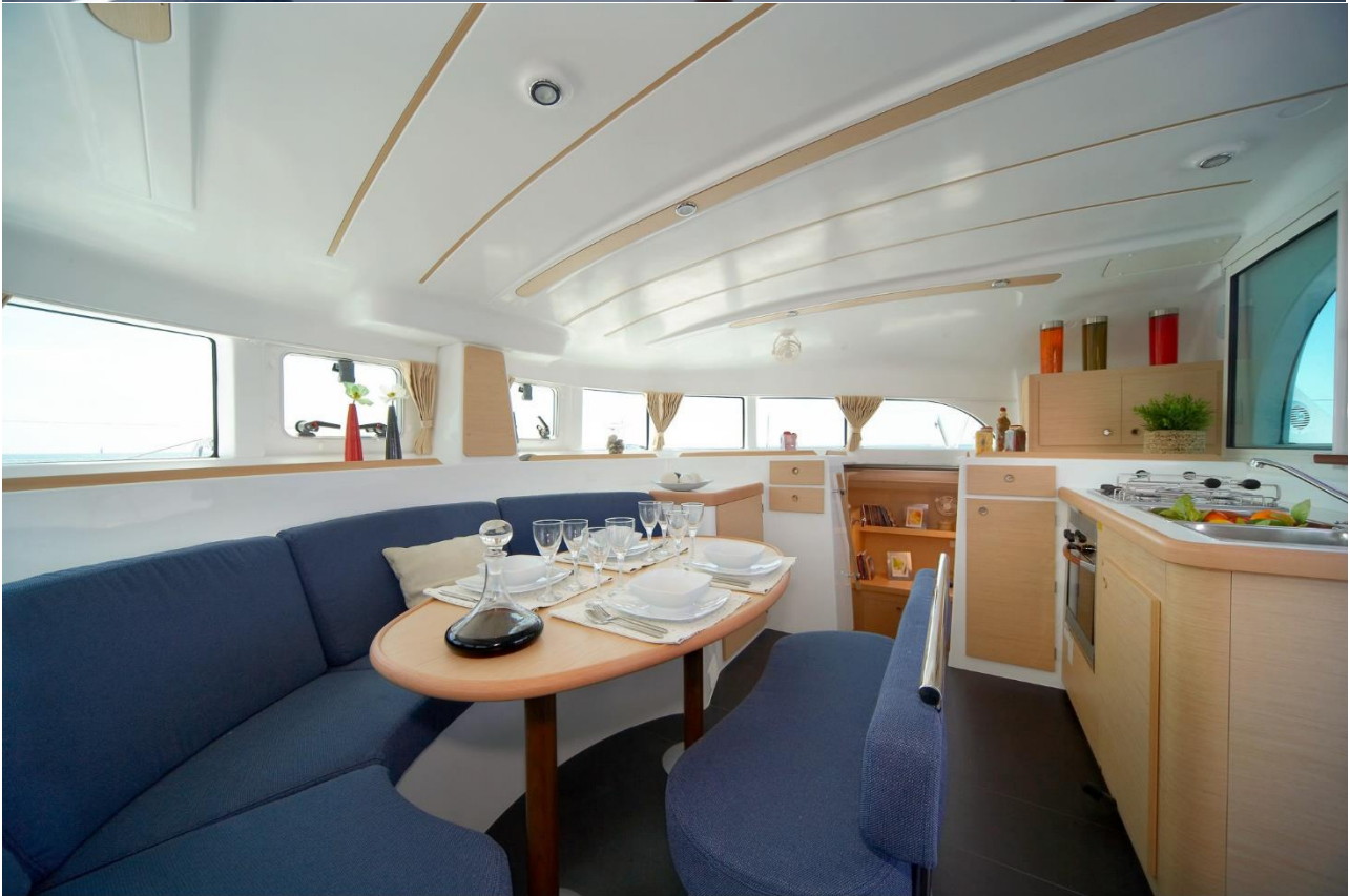
Lagoon 380 club/premium